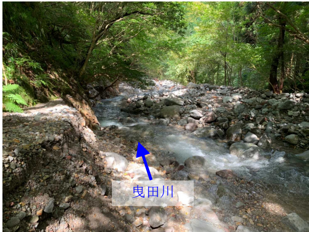
曳田川 土砂堆積状況